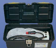
Oben: Auto mit Panne, beleuchtet mit Diamopolis 12V-100W